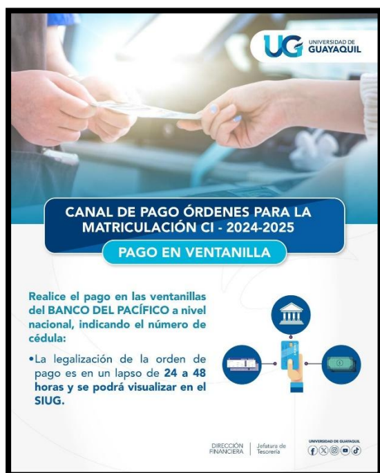
Figura 1 – PAGO EN VENTANILLA